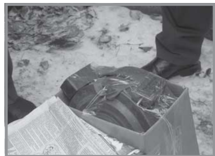
«Взрывное устройство» обнаружено