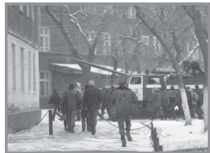
Группа поиска и пожарные приступают к выполнению задания