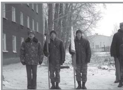
Боевые знамена эвакуируются в первую очередь - дело чести